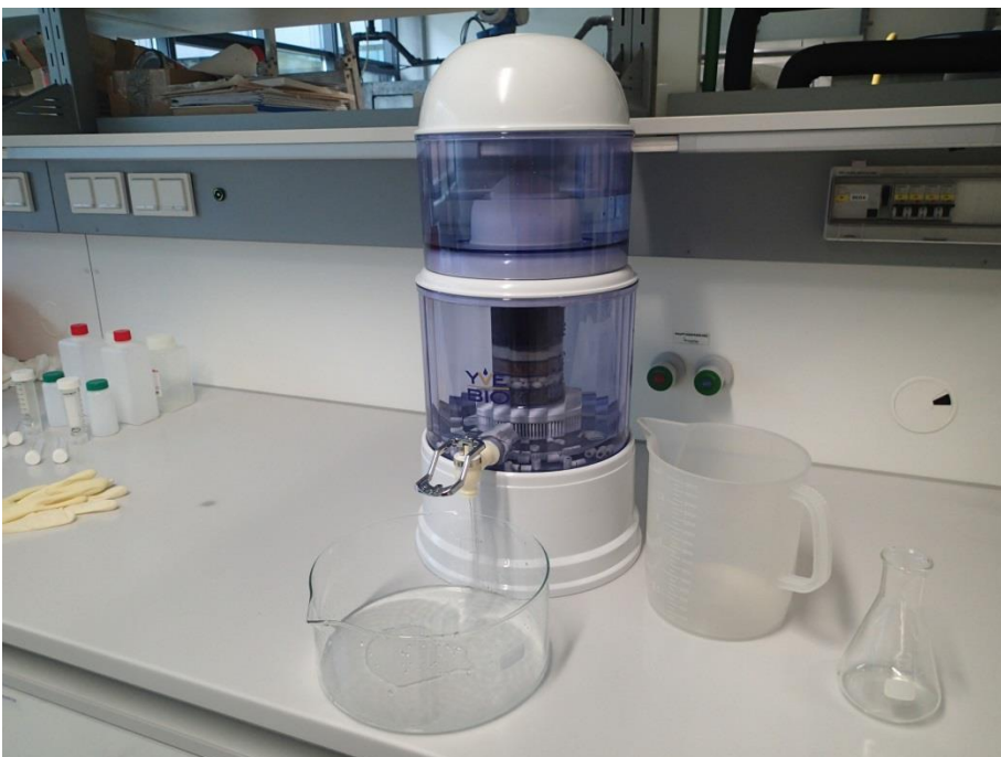
Abb. 3: Fertig installiertes YVE-3000-Wasserfiltersystem mit „YVE-BIO® 5 step Supreme Filterkartusche“

Nach dem 1. Durchlauf mit der „YVE-BIO® 4 step Kartusche-A“ wurde der YVE-3000 zerlegt, gereinigt, mit der „YVE-BIO® 5 step Supreme Filterkartusche“ versehen, zusammengebaut und der obere Behälter mit der restlichen Menge des Testwassers befüllt. Nach dem Durchlauf wurde neuerlich eine Probe zur chemischen Analyse gezogen (Probe C). Abb. 3 zeigt das fertig installierte YVE-3000-Wasserfiltersystem.