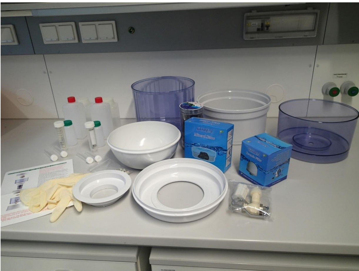
Abb. 2: Die Komponenten des YVE-3000-Wasserfiltersystems inkl. Probengebinde für Analysen

Das YVE-3000-Wasserfiltersystem besteht aus einem Keramikfilter und einer mehrstufigen Filterkartusche, zusätzlich kann in den Auffangbehälter eine Mineralienschale eingesetzt werden. EM-Pipes vervollständigen das System. Die Einzelteile des Filtersystems vor dem Zusammenbau sind in Abb. 2 dargestellt.